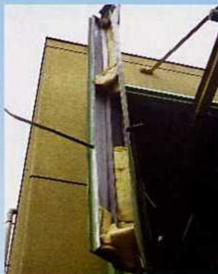
爆発による損傷箇所の一部

また、プロパンガスボンベは、販売店に返却するなど、 ごみの出し方のルールを守ってください。