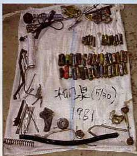
分別されずに入っていた乾電池