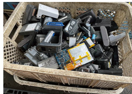
▲柳泉園組合で手選別された充電式電池

安全かつ安定した廃棄物の処理体制を維持するため、皆さまのご理解とご協力をお願い申し上げます。