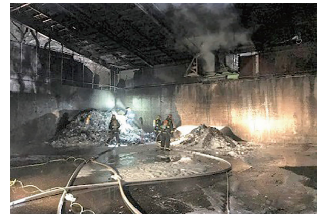
▲柳泉園組合で発生した火災における消火活動状況