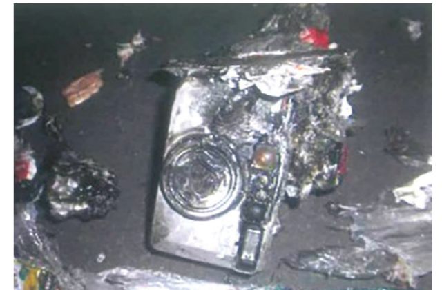
▲発火原因となった充電式電池内蔵のデジタルカメラ

充電式電池やそれらが内蔵された製品を捨てる際は、お住まいの市で定められているルールに従い、正しく分別して捨ててください。 捨て方がわからない製品がありましたら、お住まいの市役所に問い合わせるか、市役所のウェブサイトを確認 して適切に捨ててください。