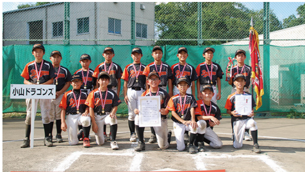
高学年の部:小山ドラゴンズ(東久留米市)

令和5年7月22日(土)に柳泉園学童野球大会が行われ、清瀬市、東久留米市及び西東京市の計6チームが熱戦を繰り広げました。 優勝チームは以下のとおりです。