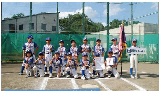
低学年の部:清瀬ツインズ(清瀬市)