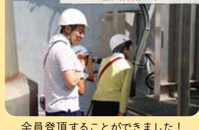
全員登頂することができました!