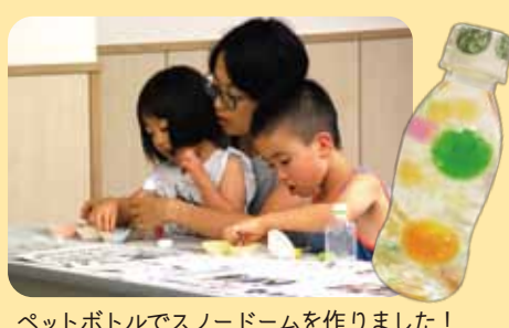
ペットボトルでスノードームを作りました!