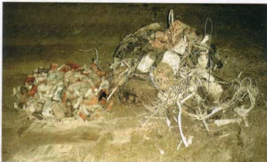
左側が乾電池、右側が金属類