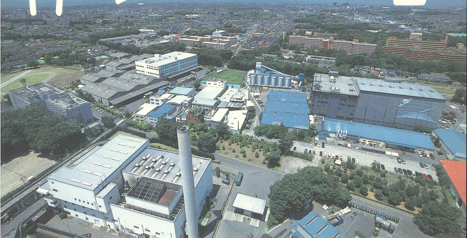
(柳泉園クリーンポートの煙突から北方を望む)